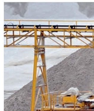
Fotos v.l.n.r.: Coal mine excavator © malajscy - fotolia.com, Carrière d'extraction de sable © Olivier Rault, kiesgrube © photo 5000 - fotolia.com, Convoyeur de carrière © Jean-Marie MAILLET - fotolia.com Lagerfoto oben: LFD Wälzlager / Sell Media Company